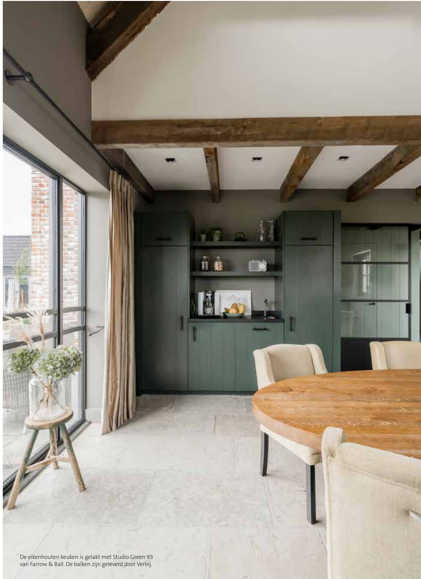
De eikenhouten keuken is gelakt met Studio Green 93 van Farrow & Ball. De balken zijn geleverd door Verbij.