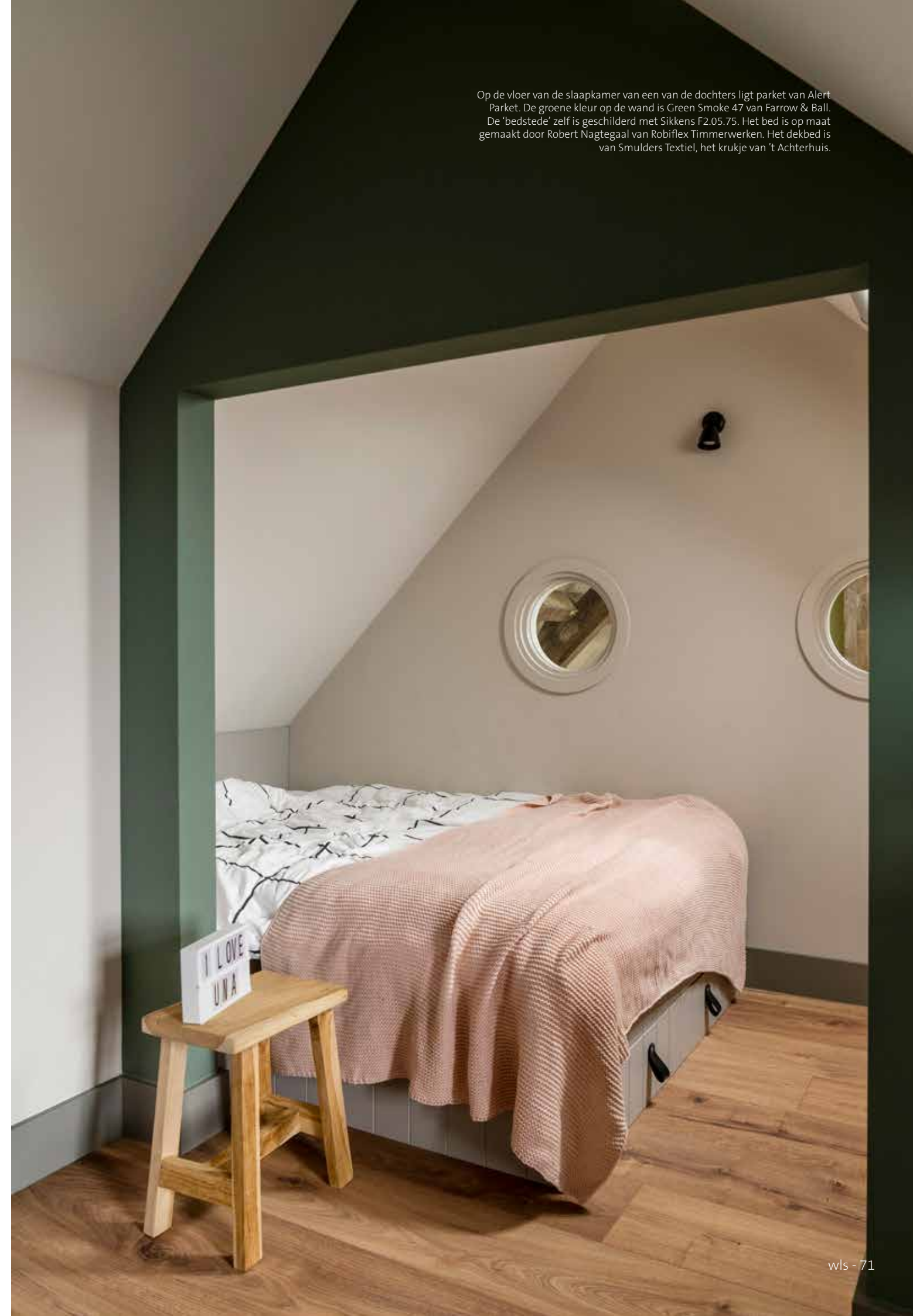
Op de vloer van de slaapkamer van een van de dochters ligt parket van Alert Parket. De groene kleur op de wand is Green Smoke 47 van Farrow & Ball. De 'bedstede' zelf is geschilderd met Sikkens F2.05.75. Het bed is op maat gemaakt door Robert Nagtegaal van Robiflex Timmerwerken. Het dekbed is van Smulders Textiel, het krukje van 't Achterhuis.