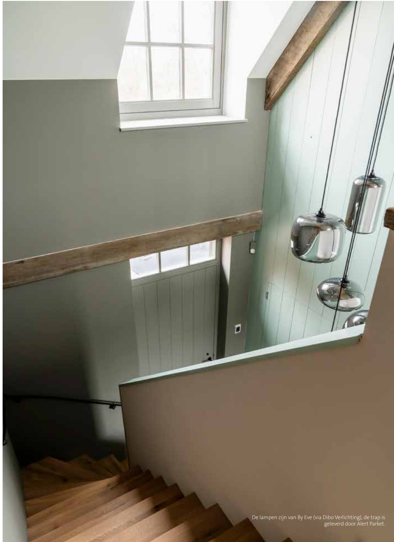
De lampen zijn van By Eve (via Dibo Verlichting), de trap is geleverd door Alert Parket.