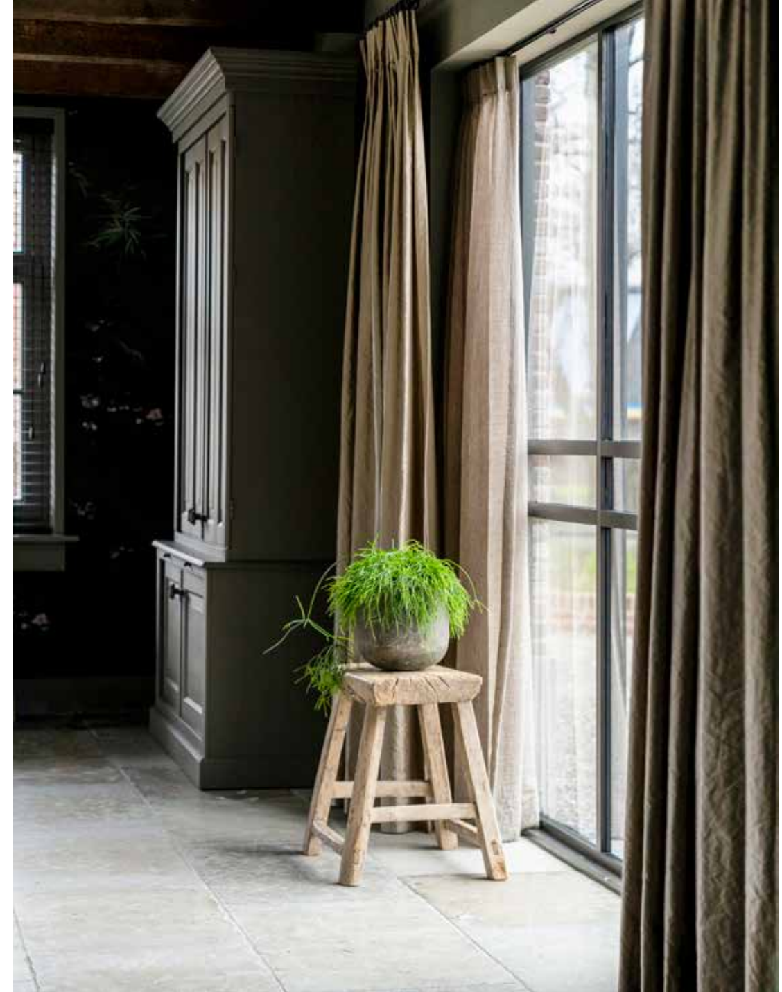
Bij het raam staat een krukje van 't Achterhuis.

Op de vloer liggen levergrijze Bourgondische dallen, type Dordogne, van Kersbergen. De houten wand die van de gang doorloopt in de hal naar boven is geveerd in een opvallende groentint: Sobek 587 van Paint & Paper Library. De roze draaistoel met hocker van Belazza Grande is bekleed met Sunnyboy-stof van Chivasso (via Baan Meubelen). De grote bloempotten zijn van Bob Bijzondere Binnenhuisaccessoires.