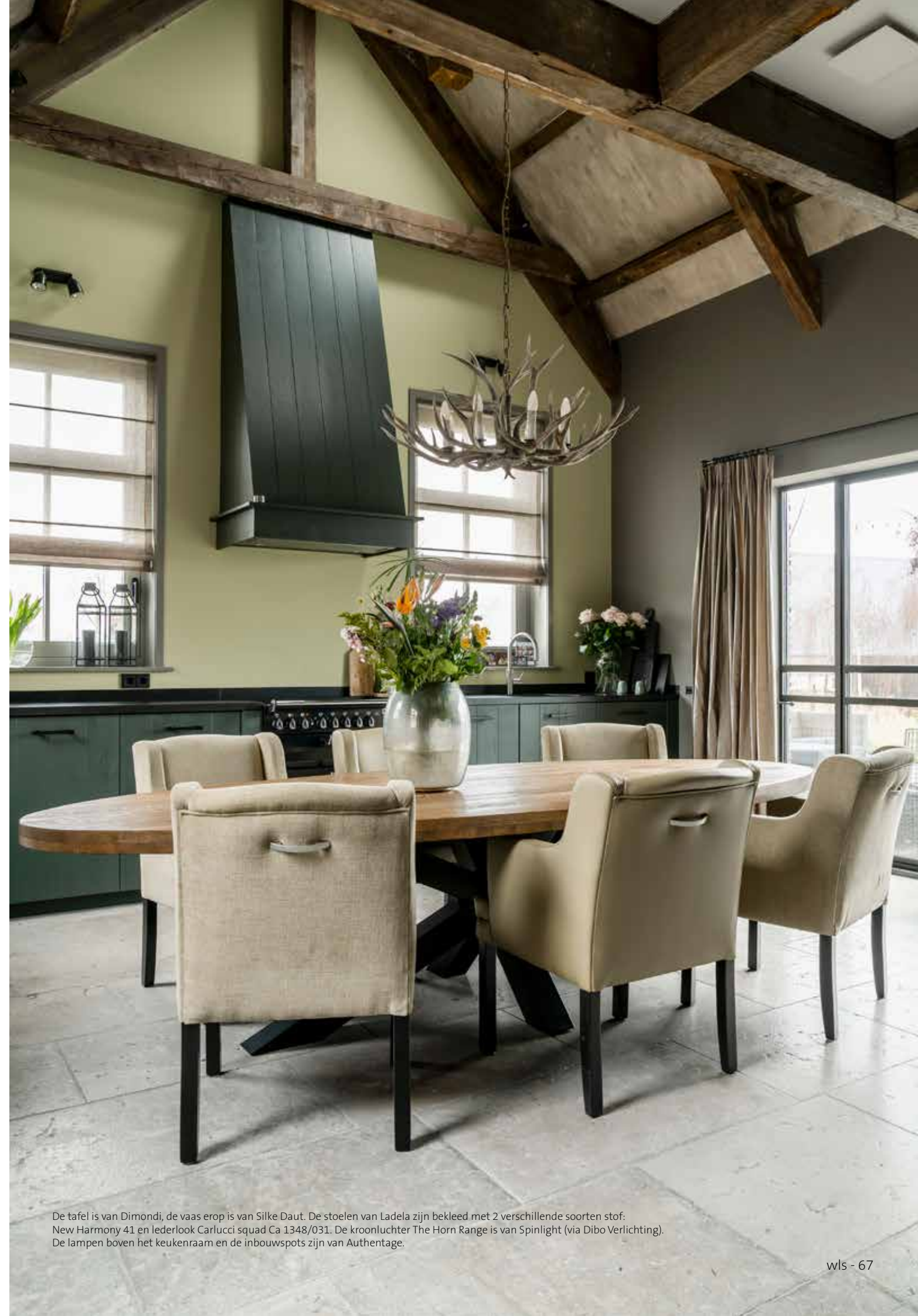
De tafel is van Dimondi, de vaas erop is van Silke Daut. De stoelen van Ladela zijn bekleed met 2 verschillende soorten stof: New Harmony 41 en lederlook Carlucci squad Ca 1348/031. De kroonluchter The Horn Range is van Spinlight (via Dibo Verlichting). De lampen boven het keukenraam en de inbouwspots zijn van Authentage.