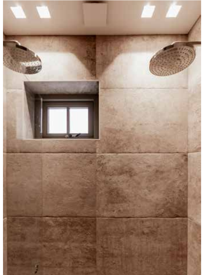
De badkamer met tegels Z 3912 is geleverd door De Zeeuw. Het badkamermeubel is op maat gemaakt door Verbij, de glanzend witte wasbakken 1322 zijn van Luva. Douchekop Raindance select P-1x 28216 is van Hansgrohe. De inbouwspots Astro Blanco 45 komen via Dibo Verlichting, de spiegelkastjes met verlichting via De Zeeuw.

“Het is een heerlijk familiehuus geworden, ik voel me er omarmd” ASTRID, BEWOONSTER